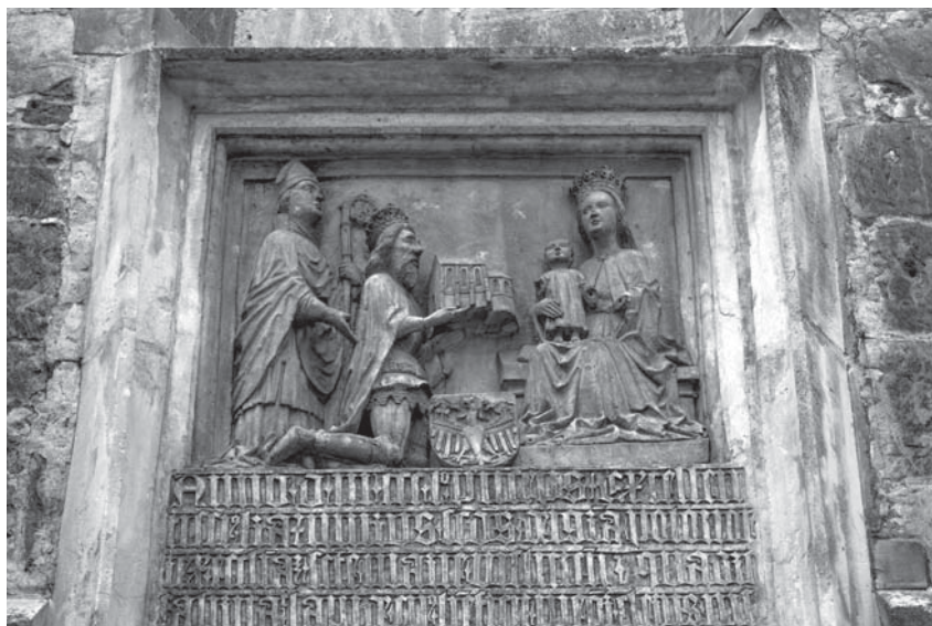
Il.8. Tablica erekcyjna Kazimierza Wielkiego, Bazylika kolegiacka Narodzenia Najświętszej Marii Panny w Wiślicy.

Tablica wiślicka z Kazimierzem Wielkim powstała z inicjatywy Długosza przeszło 100 lat po ufundowaniu kościoła 90 , natomiast tablica z Bodzentyna, znajdująca się w kruhcie kościoła pw. Wniebowzięcia Najświętszej Marii Panny i św. Stanisława Biskupa, jest jeszcze wcześniejsza, bo pochodzi z 1452 roku i przedstawia fundatora Zbigniewa Oleśnickiego ofiarującego model kościoła Madonnie na tronie. Za kardynałem stoi św. Hieronim, który poleca Oleśnickiego Maryi.