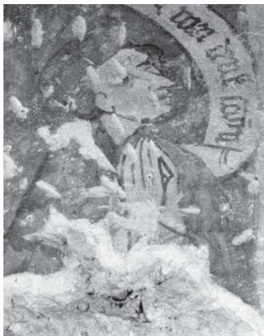
Il.3. Fragment fresku – wizerunek Jana Długosza.