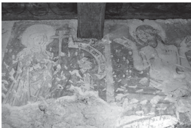
Il.4. Polichromia późnogotycka z końca XV w. z Domu Długosza w Wiślicy.

Kronikarz objął kustodię 55 w kolegiacie wiślickiej w 1445 roku 56 , w 1460 roku zaczął budować w Wiślicy dom, który dziś znany jest jako Dom Długosza 57 .