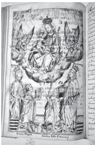
Il.1. Miniatura pochodząca z akt procesu beatyfikacyjnego św. Kingi z lat 1684-1687 (kopia miniatury dedykacyjnej z Vitae beatae Kunegundis), Archiwum Zgromadzenia Zakonnego Żeńskiego Sióstr Klarysek Zakonu św. Klary w Krakowie.