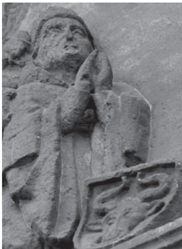
Il.7. Fragment tablicy erekcyjnej – postać Jana Długosza.

Podobny układ ma przedstawienie na tablicy fundacyjnej Domu Psalterzystów. Tu jednak znów wracamy do sceny klękania przed Maryją z dzieciątkiem, a także do żarliwej modlitwy osobistej naszego annalisty, który adoruje i składa hołd prosząc jednocześnie o zmiłowanie.