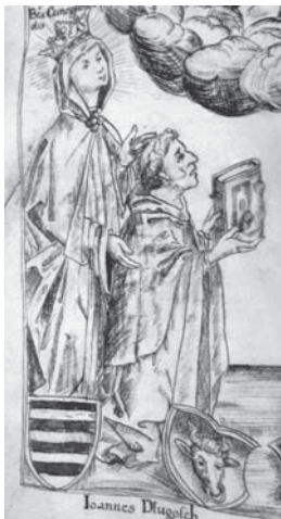
II.2. Postać Jana Długosza – fragment miniatury (fot. autorki).

W piśmiennictwie dotyczącym Jana Długosza rzadko wspomiana jest miniatura (a tak właściwie późniejsza jej kopia) pochodząca z Żywota Św. Kunegundy , którego dziejopisarz był autorem. To tu można odnaleźć najwcześniejszy zachowany wizerunek kronikarza. Jego postać została umieszczona na miniaturze dedykacyjnej wspomnianej pracy o oryginalnym tytule Vitae beatae Kunegundis . Dzieło (a właściwie dzieła 19 ) mogło powstać już ok. 1460 roku, choć przyjmuje się, że zostało ukończone przed rokiem 1474 20 , być może ostateczna redakcja nastąpiła trzy lata wcześniej, gdyż w katalogu cudów ostatni odnotowany pochodzi z kwietnia 1471 roku.