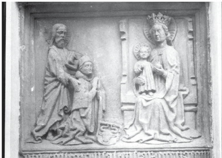
Il.6. Tablica erekcyjna z Domu Psalterzystów w Krakowie.

zbliżony do dzisiejszego i miał wygląd czapki z czterema plisowanymi rogami (zwanymi cornua od łac. cornu – róg), zbiegającymi się na środku.