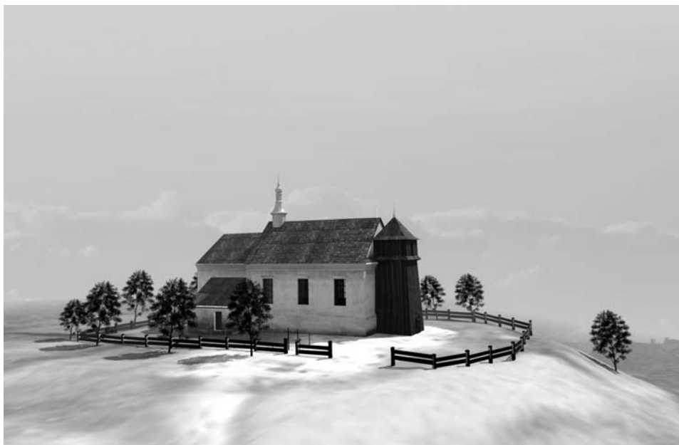
Fot. 5. Rekonstrukcja bryły starego kościoła w Konopnicy wg opisu z 1721 r. Oprac. Jarosław Sim.