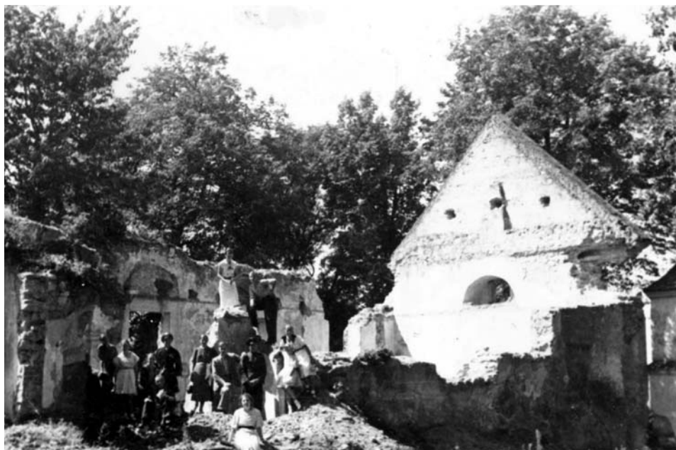
Fot. 1. Fotografia archiwalna ruin starego kościoła w Konopnicy ze zbiorów Teresy Wiśniewskiej, lata 20. XX wieku, za: „Echo Konopnicy”, nr 5-6/2019, s. 9.