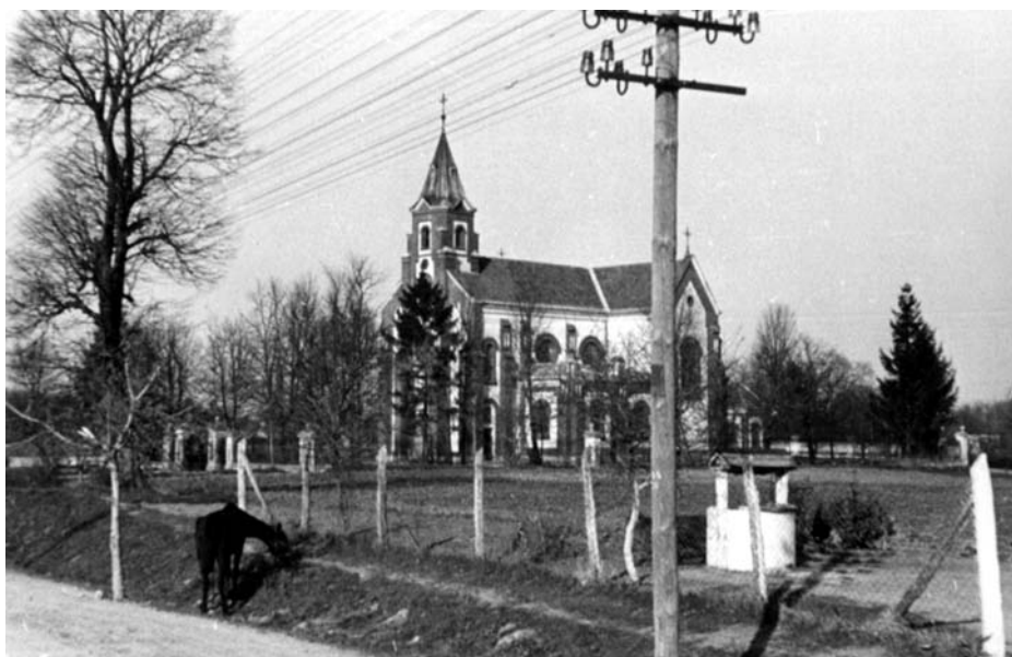
Fot. 5. Nowy kościół w Konopnicy, lata 40. XX wieku.