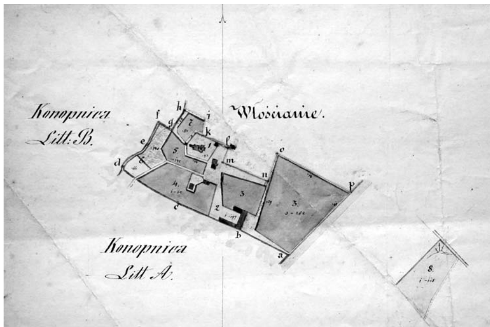
Fot. 4. Fragment planu gruntów probostwa Konopnica geometry K. Wójcickiego, 1867, AAL, Rep. 60B IVb 85, brak paginacji.