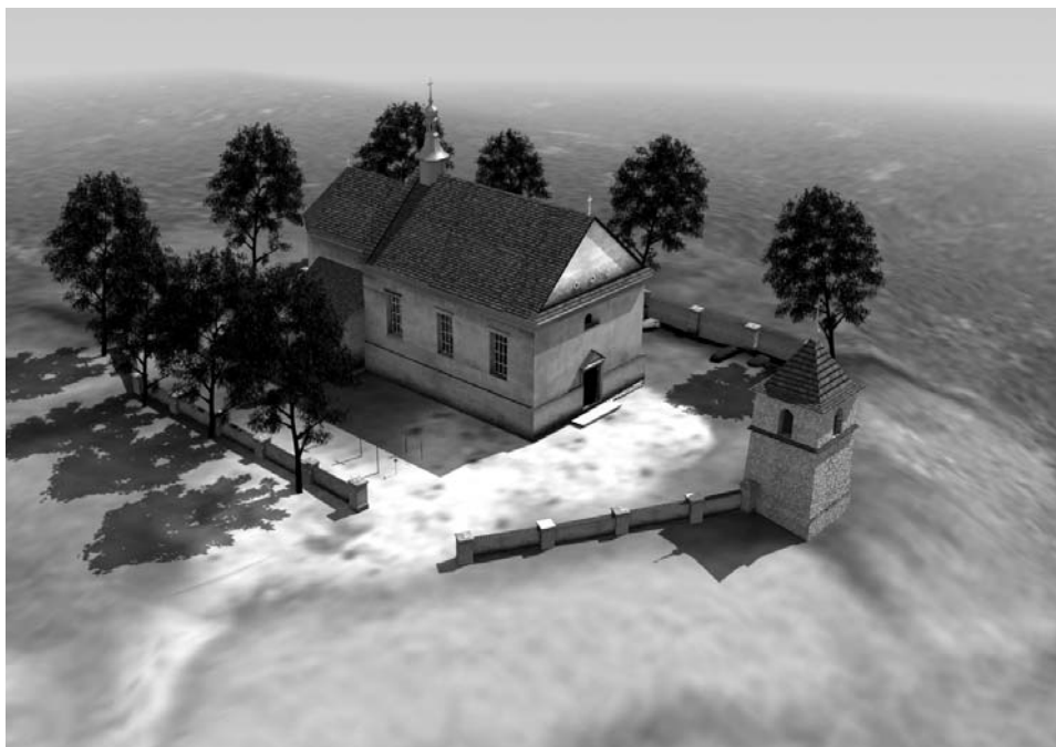
Fot. 7. Rekonstrukcja bryły starego kościoła w Konopnicy ok. 1800 r. Oprac. Jarosław Sim.