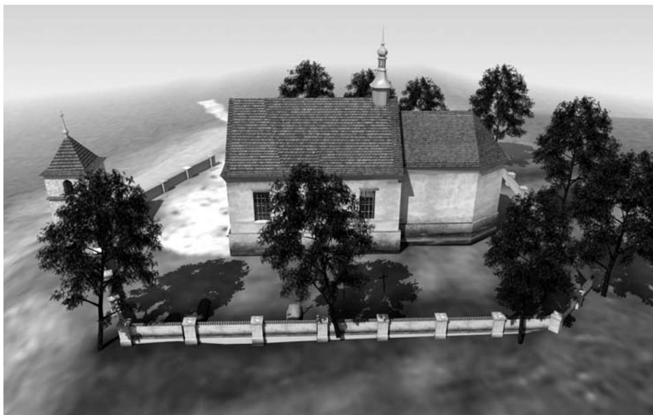
Fot. 8. Rekonstrukcja bryły starego kościoła w Konopnicy ok. 1800 r. Oprac. Jarosław Sim.