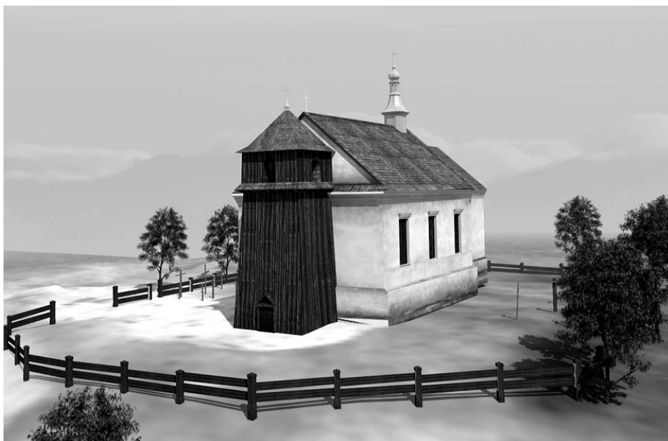
Fot. 6. Rekonstrukcja bryły starego kościoła w Konopnicy wg opisu z 1721 r. Oprac. Jarosław Sim.